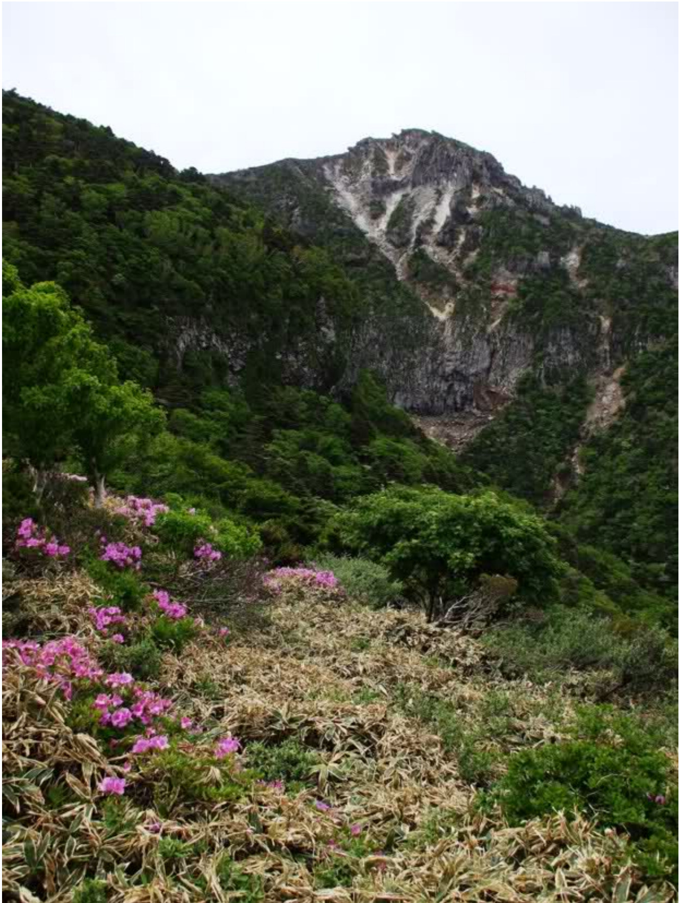
O vedere de pe traseul Gwaneumsa