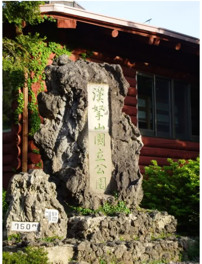
Un monument la începutul traseului Seonphanak