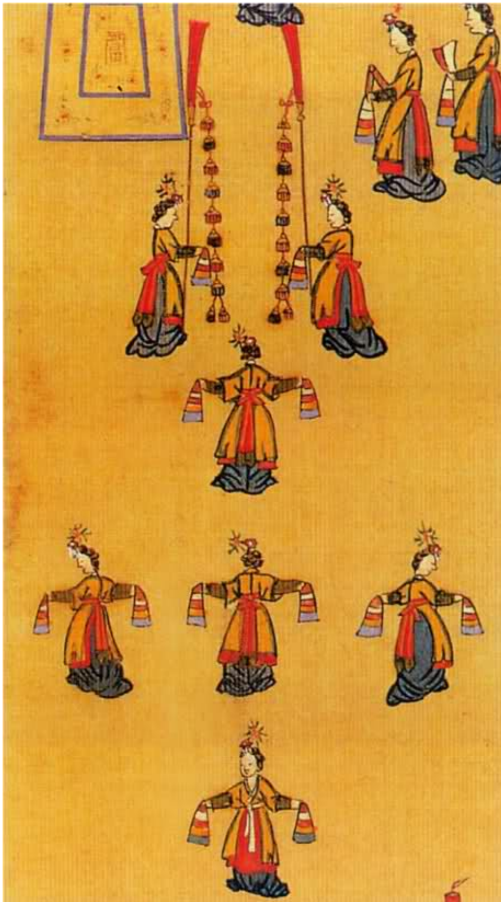
Dansul pentru longevitate, la un banchet regal organizat în 1902. De?i dansurile ?i muzica coreean? au fost puternic influen?ate de China ?i India, în timpul perioadei celor Trei