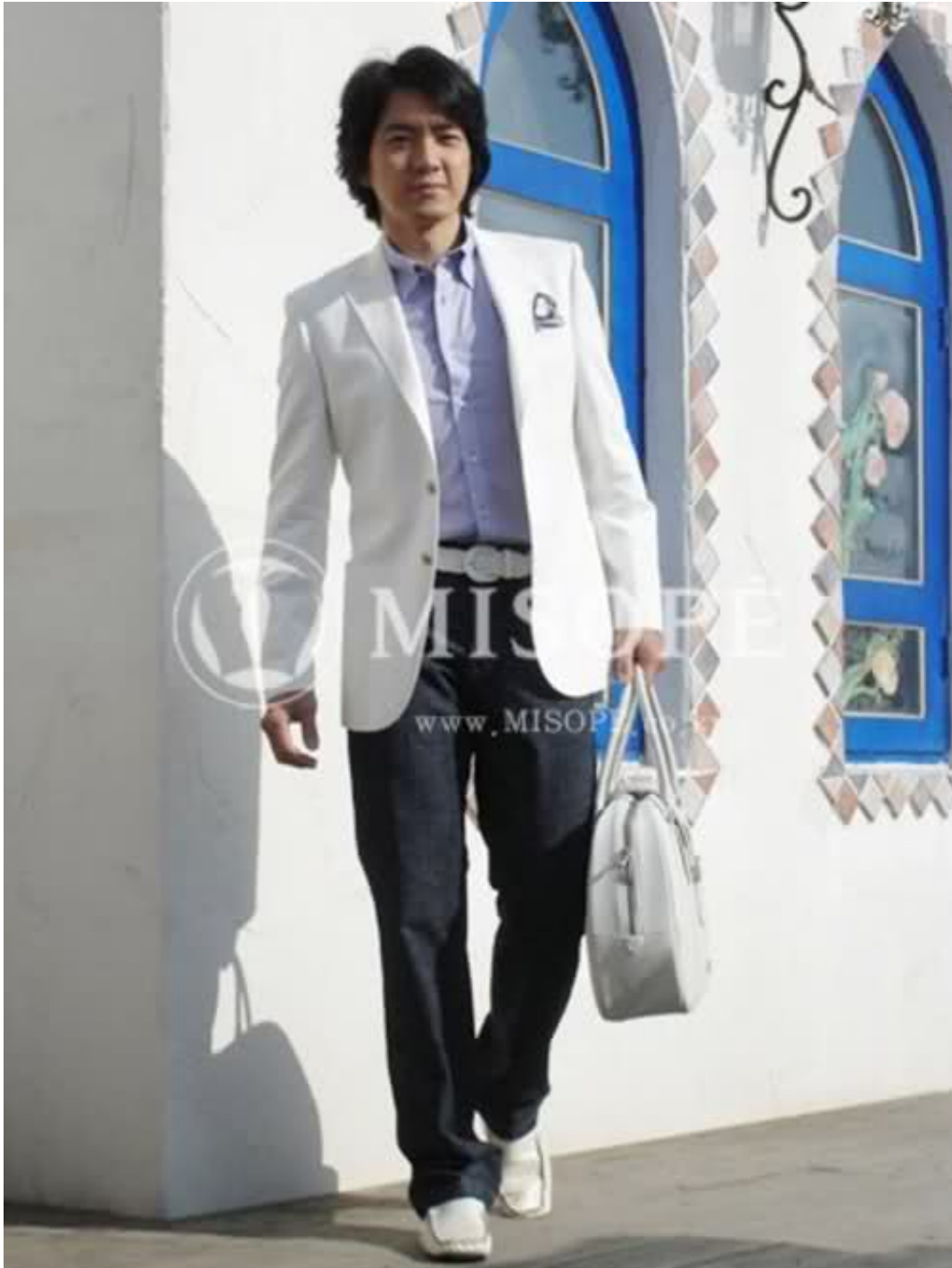
Actorul sud-coreean Song Il-gook este imaginea brandului italian MANSTAR - ?inute business ?i casual pentru b?rba?i - create de Mauro Krieger.