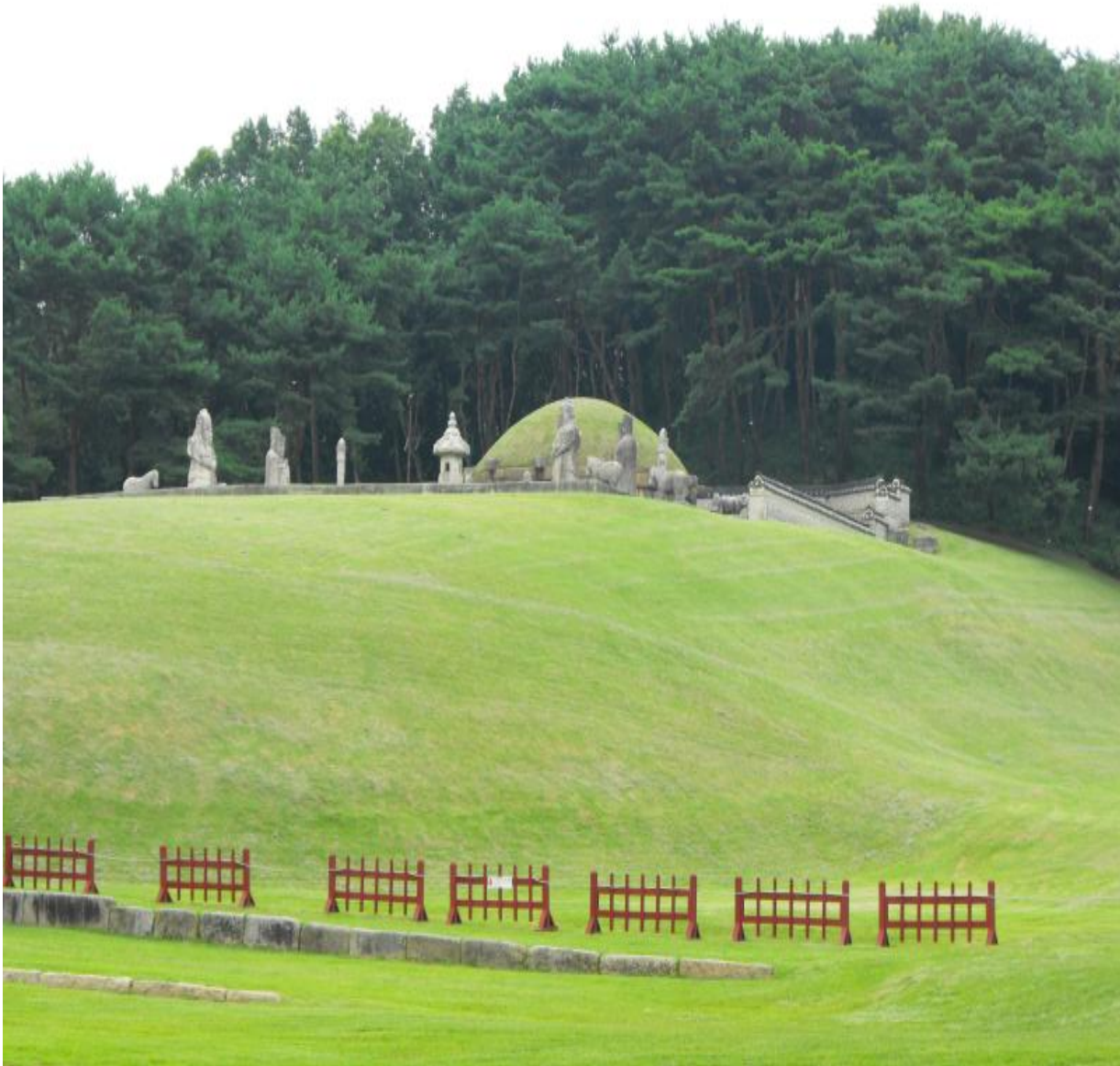
Mormantul reginei Uiin