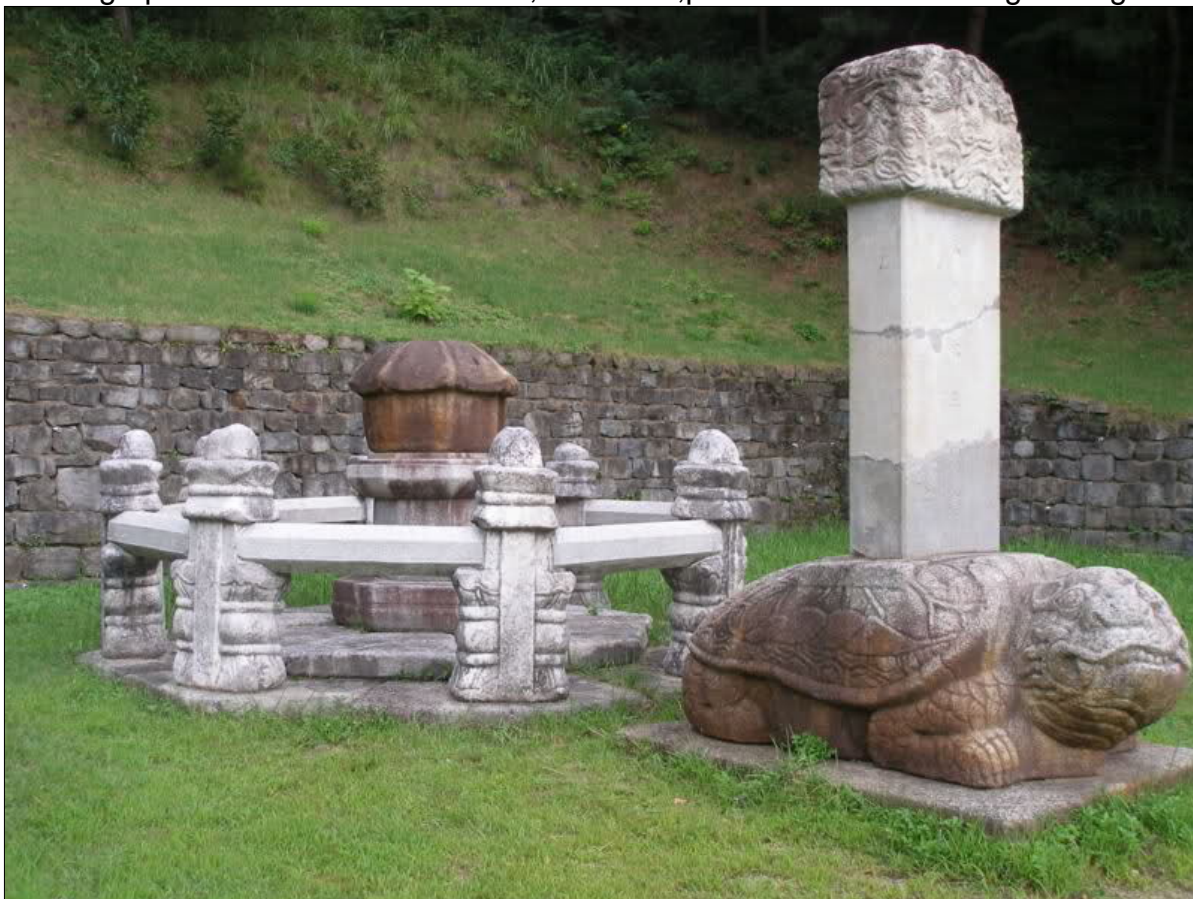
Urmeaza regele Jeongjong.

De asemenea mai exista un mormant regal,unde cordoanele ombilicale ale regelui Taejo si a fiului sau Jeongjong sunt ingropate.El se afla in Maninsan,Geumsan,provincia de sud Chungcheong.