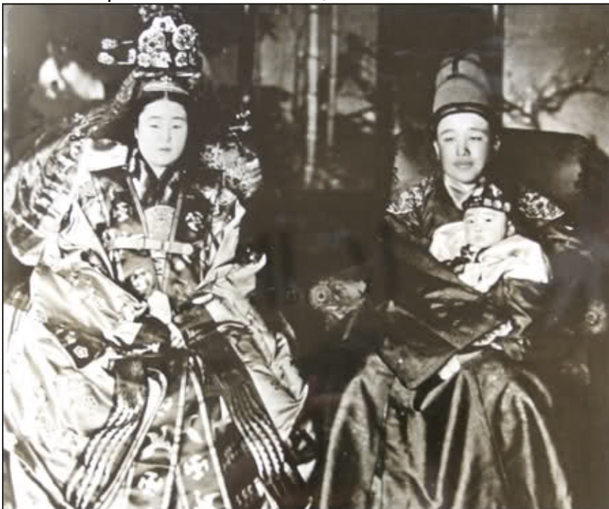
Cuplul imperial alaturi de fiul lor, micul print Jin Viata ca ultima Printesa Mostenitoare din Coreea

Mostenitoare Bangja a primit titlul oficial "Maiestatea Sa Regina Lee", atunci cand Imparatul Sunjong, fratele mai mare al Printului Euimin, a murit. Conform Tratatului Anexarii Japonia-Coreea, titlul regal coreean a fost retrogradat, de la "Imparat" la "Rege", astfel incat Printul Mostenitor Euimin nu a fost niciodata incoronat oficial ca rege; prin urmare, Printesa Masako a continuat sa fie "Bangja, Printesa Mostenitoare Euimin". La 29 decembrie 1931, ea l-a nascut pe cel de-al doilea fiu, Printul Gu.