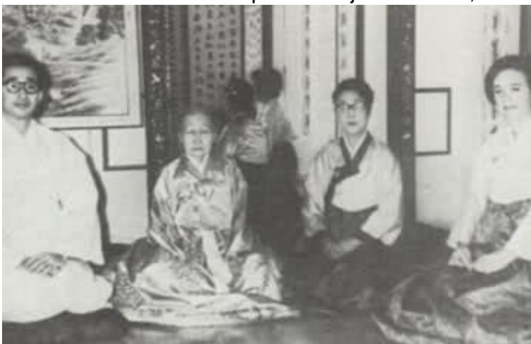
Familia Yi Moartea Printesa

Mostenitoare Bangja a murit la data de 30 aprilie 1989, la varsta de 87 de ani, la Sala Nakseon, Palatul Changdeok, din cauza cancerului. La inmormantarea sa a participat si cuplul