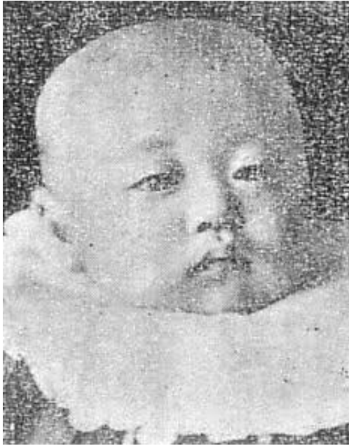
Printul Yi Jin La data de 24 aprilie 1926, Printesa

Mostenitoare Bangja a primit titlul oficial "Maiestatea Sa Regina Lee", atunci cand Imparatul Sunjong, fratele mai mare al Printului Euimin, a murit. Conform Tratatului Anexarii Japonia-Coreea, titlul regal coreean a fost retrogradat, de la "Imparat" la "Rege", astfel incat Printul Mostenitor Euimin nu a fost niciodata incoronat oficial ca rege; prin urmare, Printesa Masako a continuat sa fie "Bangja, Printesa Mostenitoare Euimin". La 29 decembrie 1931, ea l-a nascut pe cel de-al doilea fiu, Printul Gu.