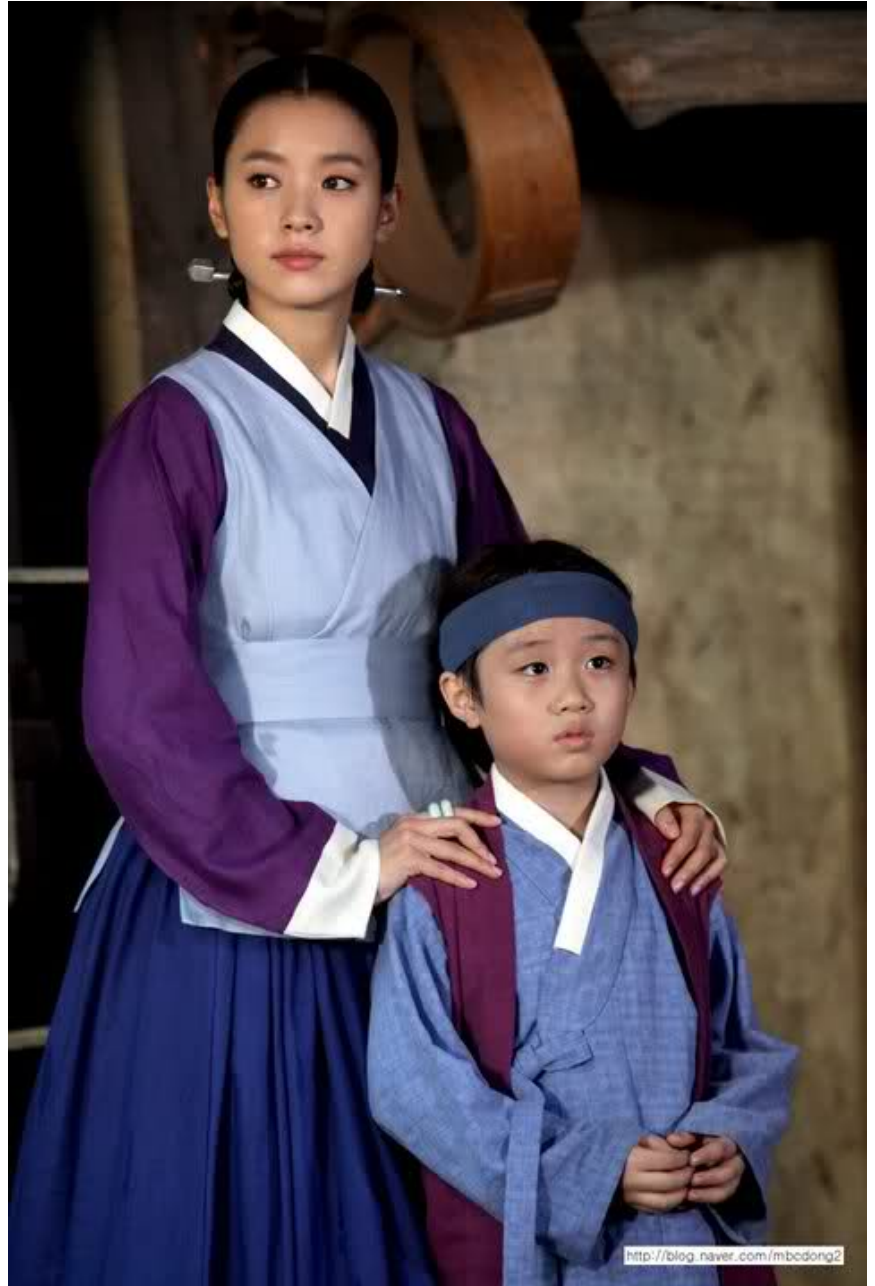
Urmeaza regele Jeongjo.