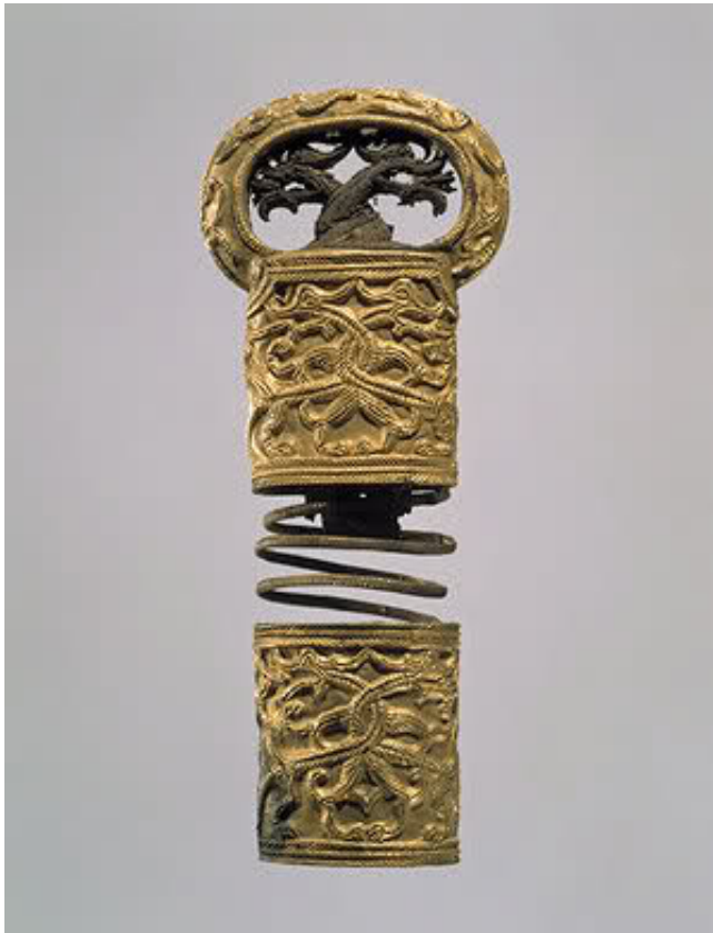
Maner de aur din perioada Shilla